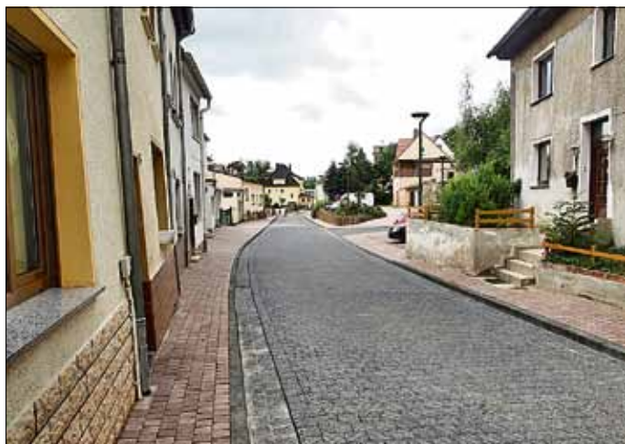
„Neue“ Obermühlenstraße in Hettstedt

Klein- und Familienanzeigen JETZT auch ONLINE gestalten und schalten!