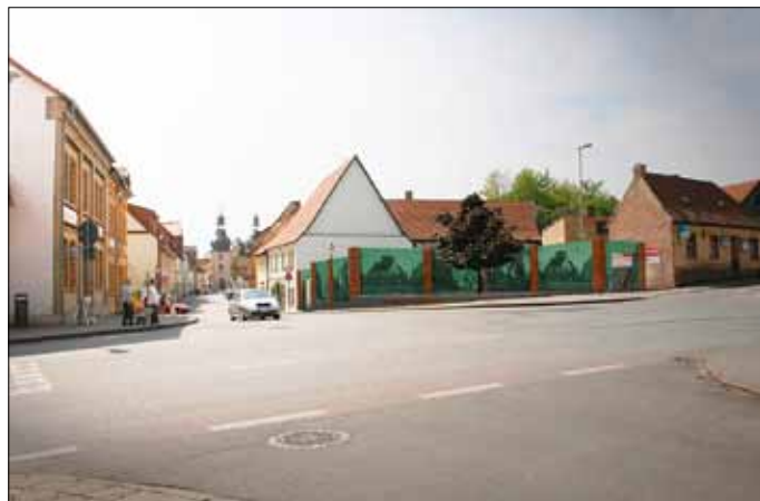
Platzgestaltung Freimarkt Hettstedt

Die Vorschläge sind bis zum 29.07.2011 bei der Stadt Hettstedt, Bauverwaltungsamt, Markt 1 - 3, 06333 Hettstedt, einzureichen.