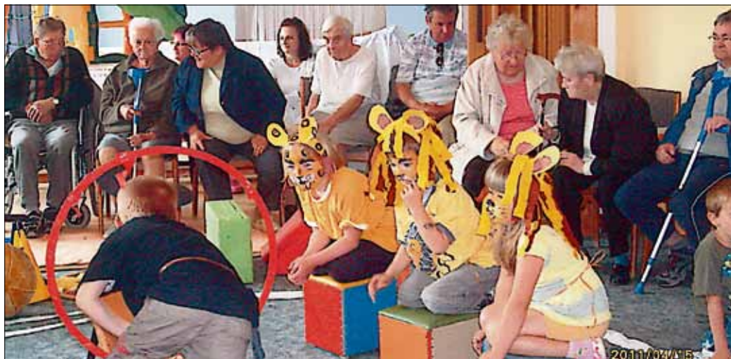
Die Kinder zeigen eine Löwendressur

Kinder und Mitarbeiter der Delta-Kindertagesstätte