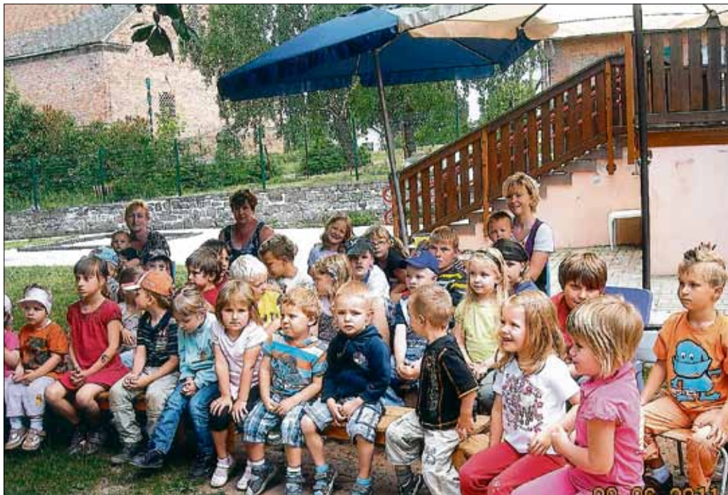
Aufmerksame Zuhörer beim Puppentheater „Der Ausreißer“