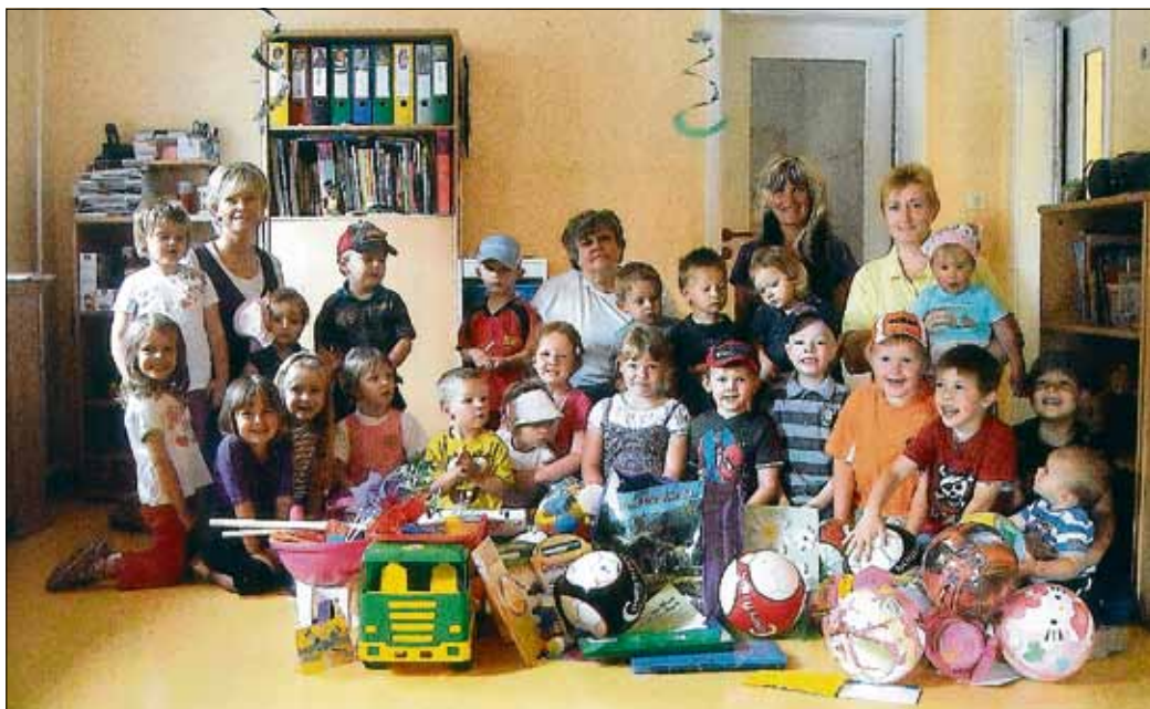
Die Kinder strahlen beim Anblick der vielen Geschenke